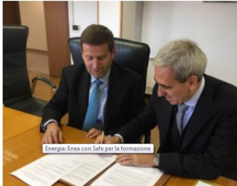
Energia: Enea con Safe per la formazione

Risparmio energetico e ambiente, nasce nuova partnership